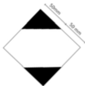
Fig. 1 Marca para los envases y/o embalajes que contengan cantidades limitadas.

De acuerdo a la NOM-011-SCT2/2012: 5.11 No será necesario que los envases y/o embalajes que contengan sustancias o materiales peligrosos en cantidades limitadas, lleven la Designación Oficial de Transporte ni el número de identificación UN de su contenido (Naciones Unidas, por sus siglas en inglés), pero deberán llevar la marca que aparece en la Figura No. 1. La marca debe ser claramente visible, legible y debe ser capaz de resistir (soportar) la exposición a la intemperie sin degradación alguna.).